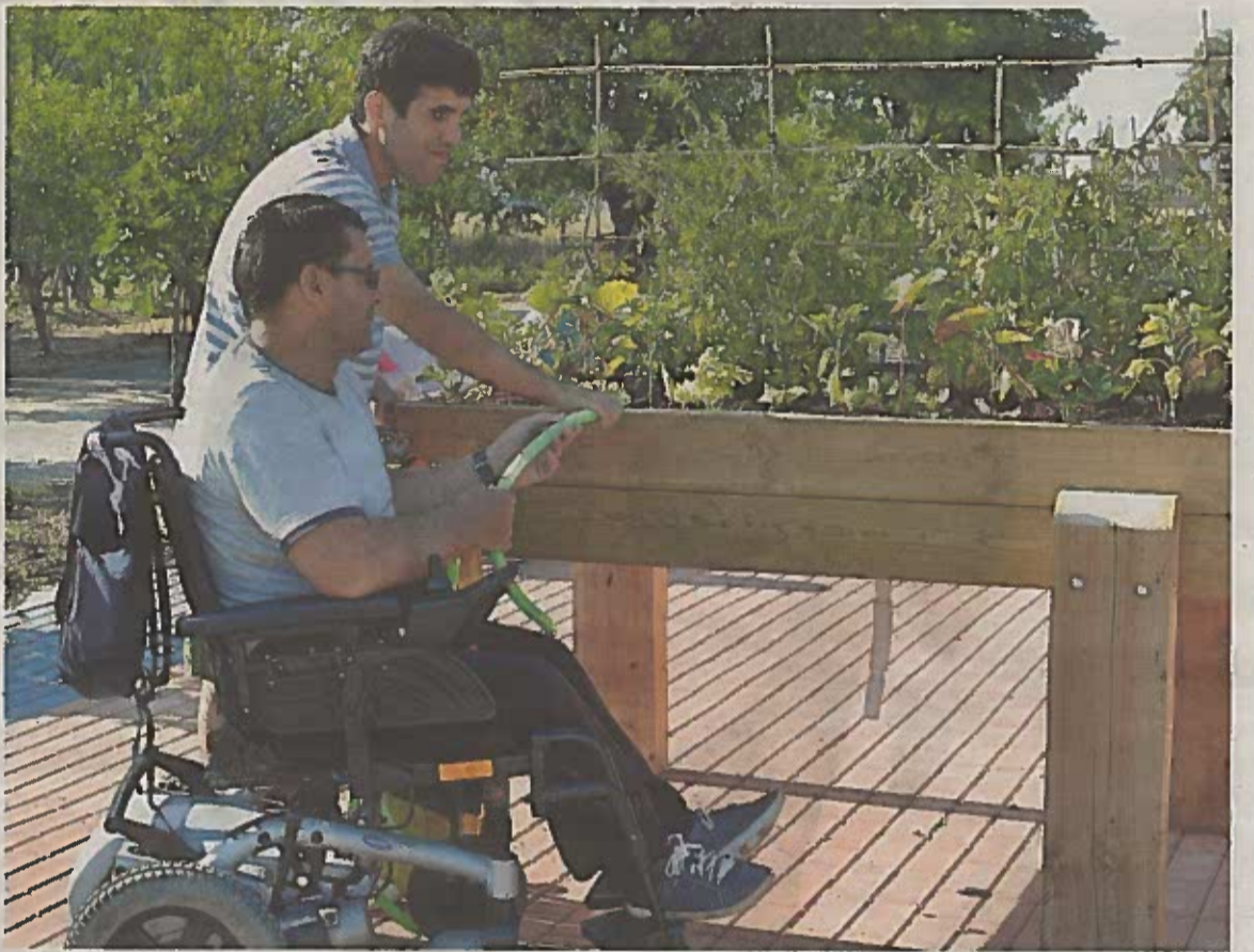
Dos residentes del centro cuidan de los huertos urbanos.

El de Valladolid es uno de los 450 centros sociosanitarios pertenecientes a la Orden Hospitalaria de San Juan de Dios, presente en 55 países del mundo y que da servicio cada día a 20 millones de personas. Su